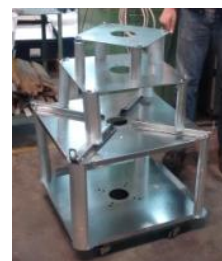
Carro gabarit e posto de trabalho