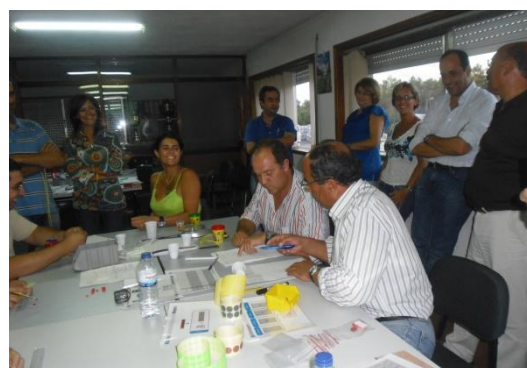
Formação Fluxo em indústrias de processo

As formações de prática simulada foram um sucesso com um feedback bastante positivo dos participantes.