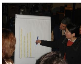
Balanceamento célula de ventiladores

No segundo workshop piloto "pés de varinha" o desafio foi maior. Porque já existia uma boa organização do posto de trabalho. Foi realizada uma análise através da Matriz de Produto-Processo (MPP),