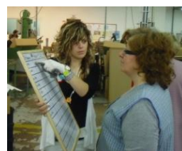
Apresentação do quadro de produção