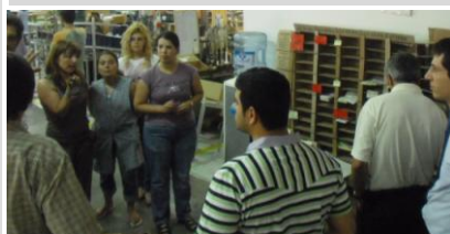
Reunião de planeamento

A aplicação destas ferramentas, foi feita pelos próprios colaboradores das células, incluindo a concepção do próprio quadro de produção. O envolvimento das pessoas garantiu uma boa aceitação destas